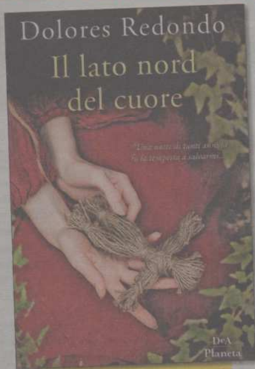
IL LATO NORD DEL CUORE di Dolores Redondo, DeA Planeta, € 18,00

seminario, Dupree viene informato che l'assassino sta per colpire di nuovo nella città di New Orleans, dove sta anche per abbattersi un terribile uragano. Deciso a tentare il tutto per tutto per sventare i malvagi propositi del criminale, allestisce una squadra speciale di agenti nella quale, a sorpresa, viene convocata anche la Salazar. Poco prima di agire, però, Amaia riceve una telefonata dalla natia Navarra, per la precisione da Elizondo, nella valle del Baztan, che la costringe a riaprire vecchi casi irrisolti e a fare i conti con un'esperienza dolorosa che credeva di aver sepolto nel "lato nord" del suo cuore. Nata a San Sebastián nel 1969, Dolores Redondo ha studiato Legge e lavorato in vari settori prima di diventare scrittrice a tempo pieno. Ha pubblicato romanzi tradotti in 35 lingue. Tra i suoi precedenti titoli, ricordiamo Il guardiano invisibile e Tutto questo ti darò , vincitore del premio Bancarella nel 2018.