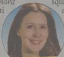
Dolores Redondo (51 anni)

Q uando si sceglie di combattere il crimine, non si finisce mai di imparare. Ne sa qualcosa la giovane e brillante detective della polizia di Navarra, Amaia Salazar: è lei la protagonista del nuovo romanzo della scrittrice spagnola Dolores Redondo, Il lato nord del cuore . Per affinare le sue doti investigative, Amaia lascia temporaneamente la Spagna per sbarcare negli Stati Uniti a Quantico, quartier generale dell'Fbi. Si trova lì per seguire un seminario - riservato a ufficiali dell'Europol come lei - tenuto dall'agente speciale Aloisius Dupree. Per far lavorare sul campo i suoi allievi, questi li invita a formulare ipotesi sul conto di un misterioso serial killer che agisce da tempo nell'ombra. L'unica cosa che si sa di lui è che ha un debole per le catastrofi naturali e per i rituali liturgici, riprodotti sulla scena del crimine con una precisione inquietante. Senonché, nel bel mezzo del